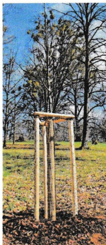
Im Außenpark wurde eine Winterlinde gepflanzt.

Bad Liebenstein – Gestern wurde die Bundesgartenschau 2021 in Erfurt und damit auch der Außenstandort im Schlosspark Altenstein offiziell eröffnet, am morgigen Sonntag wird der Tag des Baumes begangen: Es sind gleich zwei gute Gründe, weshalb die Stiftung Thüringer Schlösser und Gärten und die Stadt Bad Liebenstein zur Baumpflanzung eingeladen haben. In die Erde gebracht wurden eine Blaue Stechfichte im Innenpark unweit des Schlosses und eine Winterlinde im Außenpark.